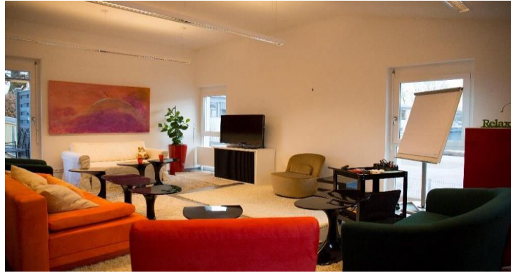
Akademie-Zentrum: Tannenstraße 10 82223 Eichenau bei München

Die Ausstattung der Räume ist hervorragend. In den Seminarräumen stehen Flipcharts, Pinnwände, Rechner/Beamer, Moderatorenkoffer, Übungsmaterialien für Rollenspiele und Gruppenarbeiten, zur Verfügung. Suggestopädisch eingerichtete Räume mit unterschiedlichen Sitzmöbeln laden dazu ein, sich nicht nur geistig, sondern auch körperlich zu bewegen und immer wieder die eigene Position zu verändern. Das bietet die Möglichkeit zu intensivstem Arbeiten und zur Entspannung.